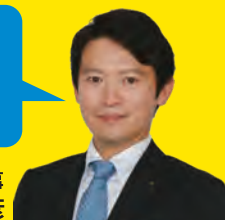
兵庫県知事 齋藤 元彦

皆さん、いざというときの備えはできていますか。 フェニックス共済で自然災害の被害に備えましょう。